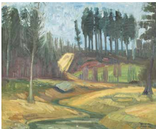
Landskap. Målning utställd på genombrottsutställningen på Färg och Form 1941.