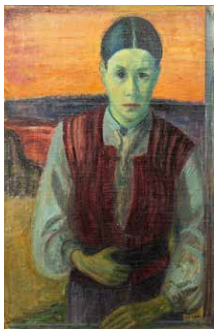
Självporträtt. 1929 eller tidigt 1930-tal.

Den västerbottniska naturen i Umeås närhet, i Stöcksjö, längs Umeälven och på Röbbäcksslätten, blev snabbt till Veras favoritmotiv tillsammans med porträtten som fortsatt var en viktig del av hennes