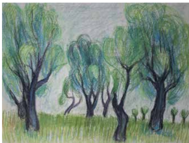
Olivlund i Cagnes-sur-Mer. 1939. Krita.