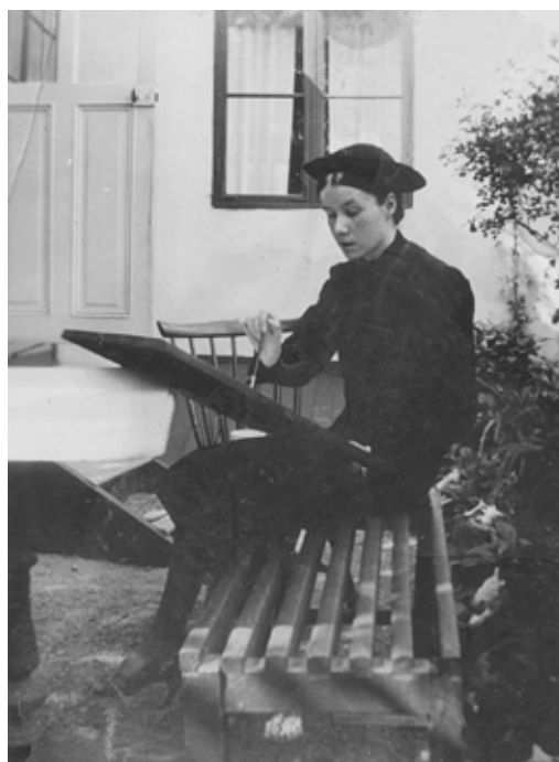
Porträttmålning i Djursholm. 1940-talet.

Ur brev till Olle under pågående utställning på Färg och Form, 1941.