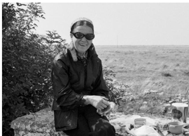
Öland sommaren 1981.

I Stöcksjö, på myren, slätten och längs Umeälvens stränder hade Vera sina favoritplatser. Motiven återkommer, men aldrig fångade på exakt samma sätt. Landskapets element är fångade ur olika vinklar med färger som komponeras på olika sätt. Och så himlarna. Från dovt ljusa till sprakande röda och orangea.