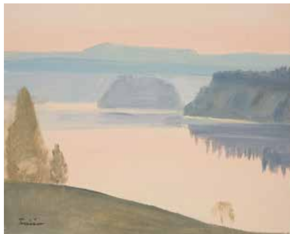
Umeälven vid Kolksele.

Redan efter två terminer hos Otte Sköld hade Vera erövat kunskaper om hur hon kunde måla det västerbottniska landskapet i skymnings- och gryningsljus på