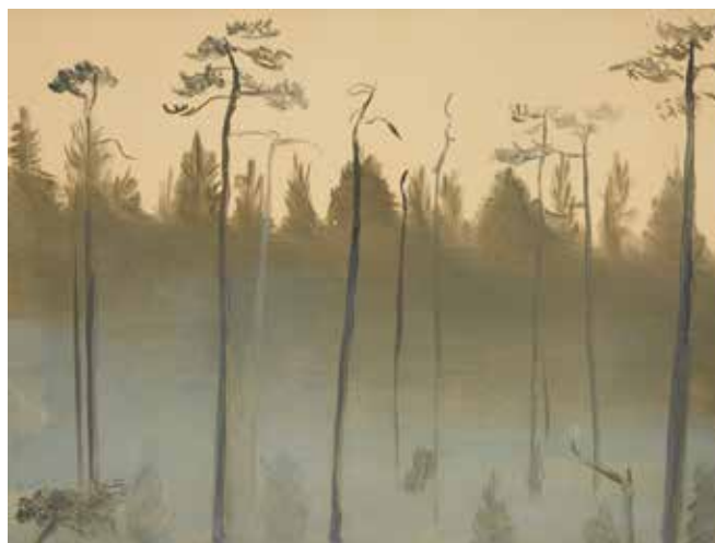
Myren i Stöcksjös närhet.