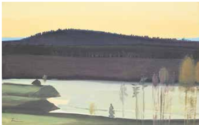
Umeälven vid Kolksele.

forsar fram som ett lokomotiv genom natten" speglas himlens, de skogsklädda kullarnas och strandbrinkarnas färger. Och i skogspartierna känns den svärta i olika nyanser igen som Vera arbetade med redan i slutet av 1920-talet. På älvens yta dröjer ofta tunna flak av de sista resterna av vinterns isar. Känslan av de kyliga nätterna vid älven och att målningarna berättar något som bara kan förnimmas är påtaglig.