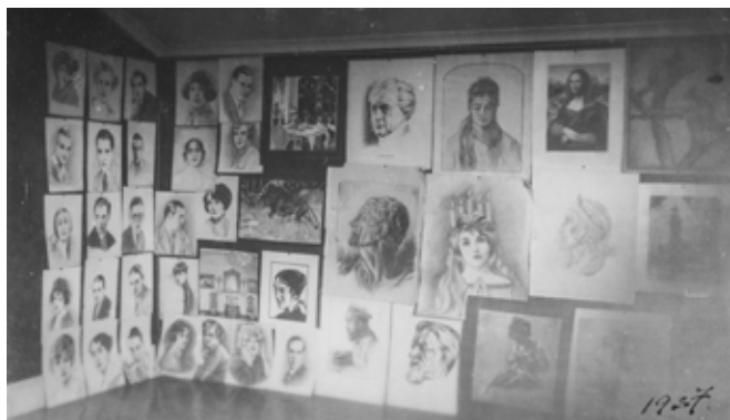
Ett rum på Dragongatan med väggarna täckta av Veras teckningar. 1927.

Umeås växande kulturliv på 1920-talet var säkert en bra grund för en ung person med ett växande