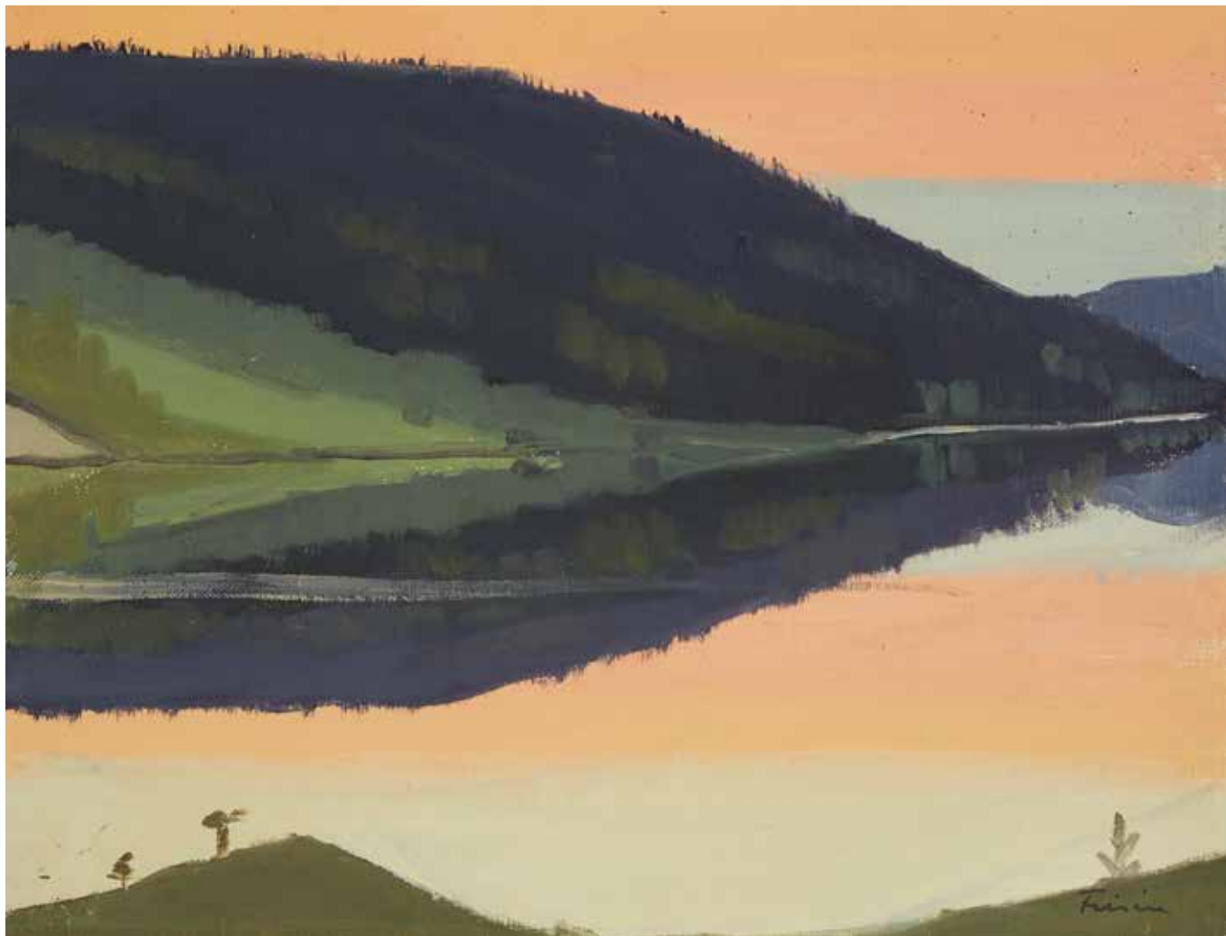
Umeälven i närheten av Kolksele.

UMEÅ 400 ÅR, VÄSTERBOTTNISK KVINNOHISTORIA