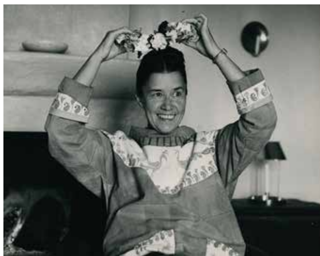
50-årsfirande i sommarhuset på Öland 1960.

Möjligheten att kunna tillbringa mycket tid i Stöcksjö under vårar och försomrar verkar ha lett till en påtagligt kreativ och produktiv fas. Nya färgtoner kom till och kombinerades på nya sätt. På Röbbäcksslätten