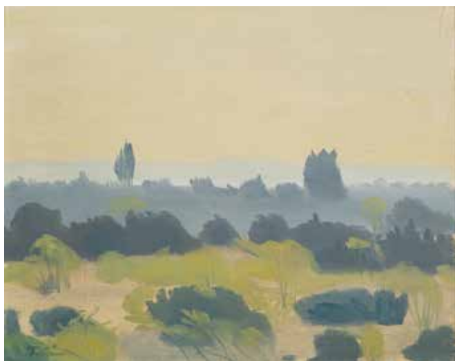
Öland. Alvaret vid sommarhuset.

"Stöcksjö är förfärligt fult. Det säger alla och det kan ju hända men mej har det gett allt. Jag glömmar aldrig den hisnande känslan första gången jag kom hit