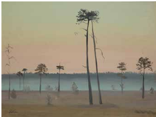
Myren i Stöcksjös närhet. Troligen från cirka 1980.