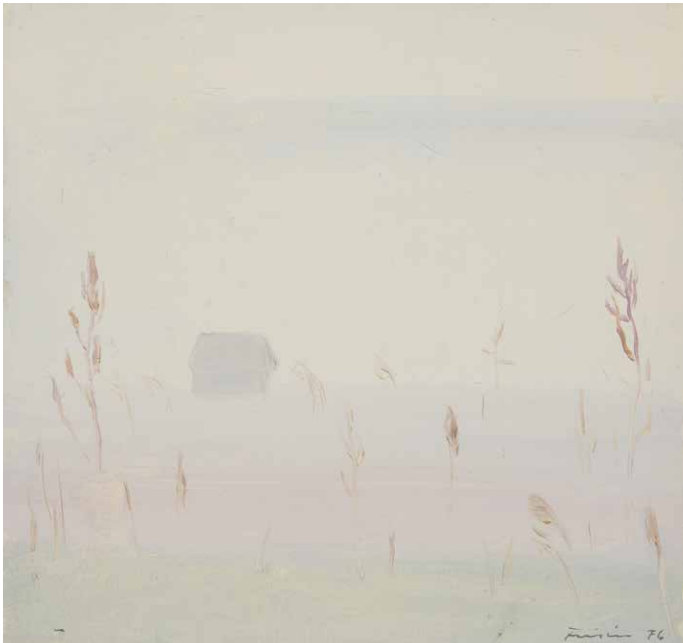
Röbäcksslätten i dimma.