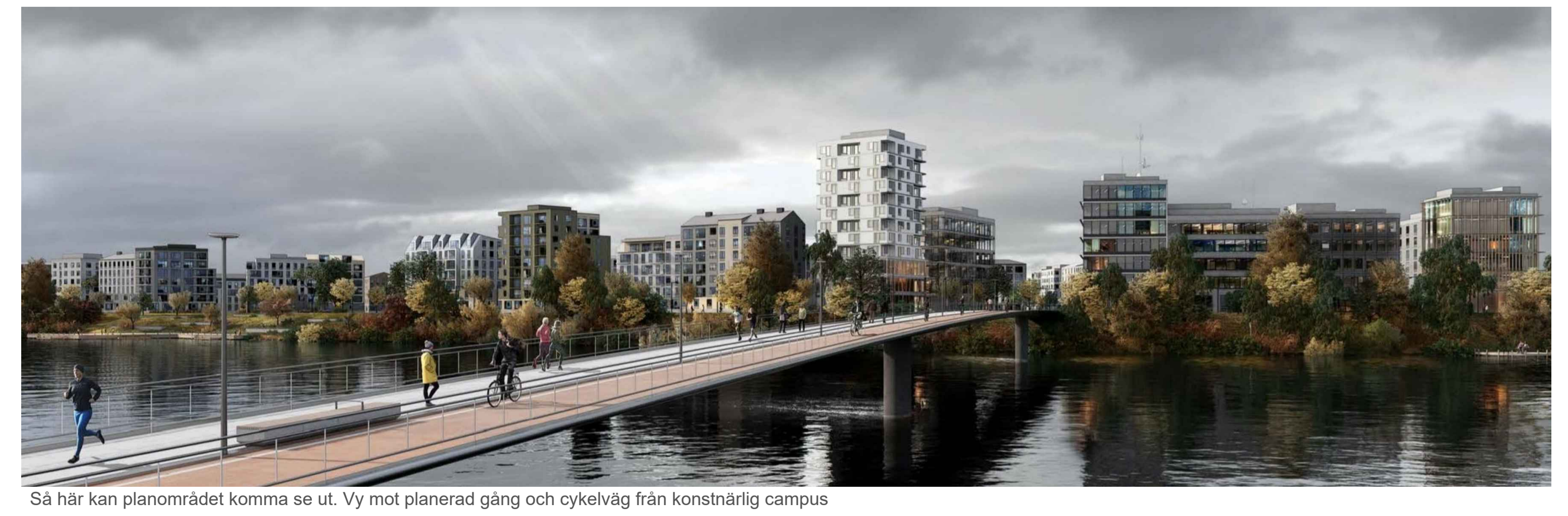
Så här kan planområdet komma se ut. Vy mot planerad gång och cykelväg från konstnärlig campus