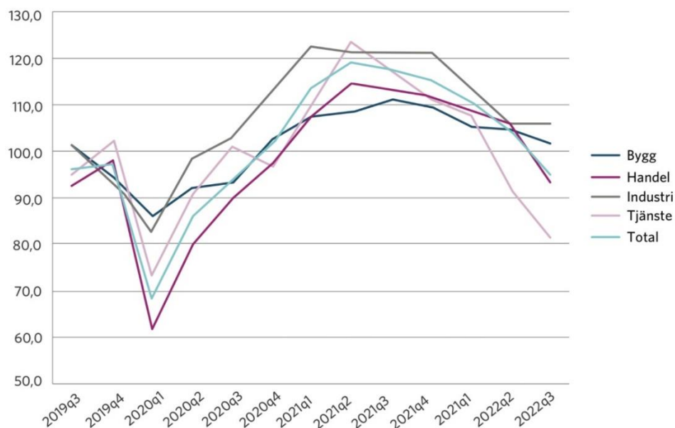
Figur 1. Konfidensindikatorn för näringslivet i Västerbotten har försvagats under 2022 i linje med övriga län och riket. Konfidensindikatorn tas fram genom en företagsenkät och mäter nuläget i näringslivet samt hur företagen ser på närmaste framtiden

Konjunkturinstitutet ger en bild av att både hushåll och näringsliv har en pessimistisk syn på konjunkturen framöver.