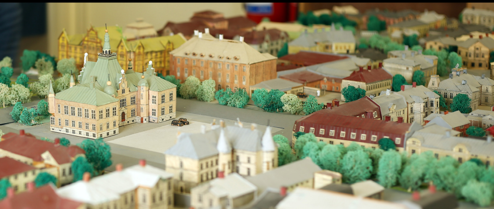
Delar av Folke Hübinettes modeller av Umeå stad före branden 1888 (överst) och på 1930–1940-tal.