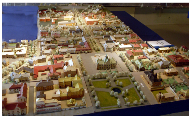
[Bild 04] Centrala Umeå 1930–1940-tal. Del av en av stadsmodellerna.

Tidsmässigt är modellerna från 1930–40 talet, men eftersom rivningarna av de äldre husen i Umeå centrum inte kom igång förrän i början av 60-talet, känner många lite äldre umebor väl igen miljöerna. Utöver själva modellerna finns kartor över Umeå från 1600-talet och framåt, cirka 1 500 foton från tiden före stadsbranden 1888 fram till idag, en samling böcker med lokalhistoria och förteckningar över caféer, bagerier, livsmedelsaffärer, biografier med mera.