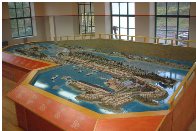
Folke Hübinettes modell av Mo och Domsjöns sågverksanläggningen på Norrbyskärs (1895–1952). Översikt.