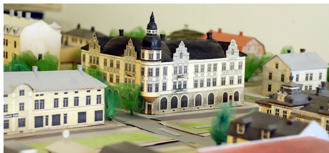
Bolagshuset (Skandinaviska banken) på Rådhusplanaden. Byggt 1901, ritat av Gustaf Hermansson. Byggnaden revs 1966.

De byggnader som brukar få mest uppmärksamhet från besökarna är Bolagshuset och Sundsvallsbanken, två pampiga stenhus som revs på 60-talet.