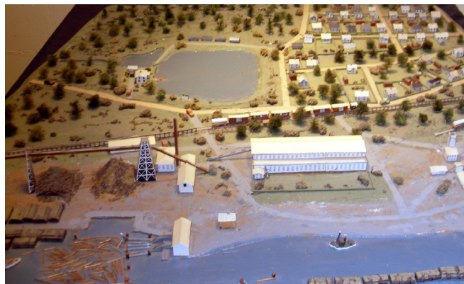
Sofiehems träsliperi (senare Bowaters).