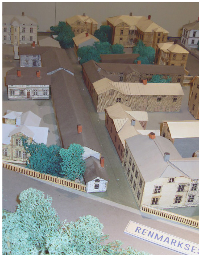
Gamla Rådhusgatan från före branden.

Totalt har flera tusen personer hittills sett utställningen och vi hoppas att ännu fler kommer att besöka oss framöver.