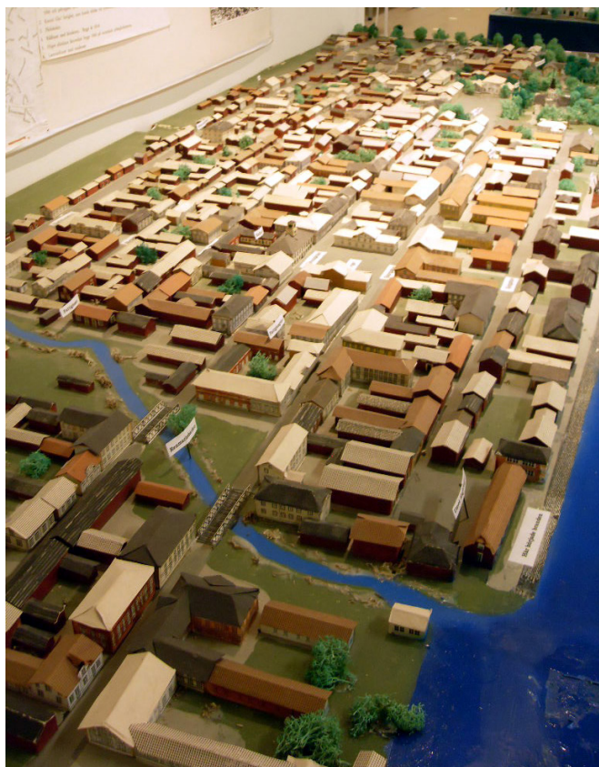
Umeå stad före stadsbranden 1888.

På bilden nedan ses en liten del av den gamla Rådhusgatan från före branden. Den gatan försvann i den nya stadsplanen, men denna del, som klarade branden eftersom den var belägen väster om Renmarksbäcken, fanns kvar en bit in på 1960-talet. Det finns faktiskt en