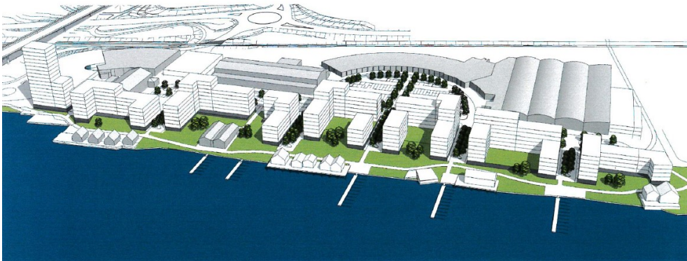
Volymstudie från ansökan.

Avgift för planbesked tas ut för stor åtgärd med 17 160 kr.