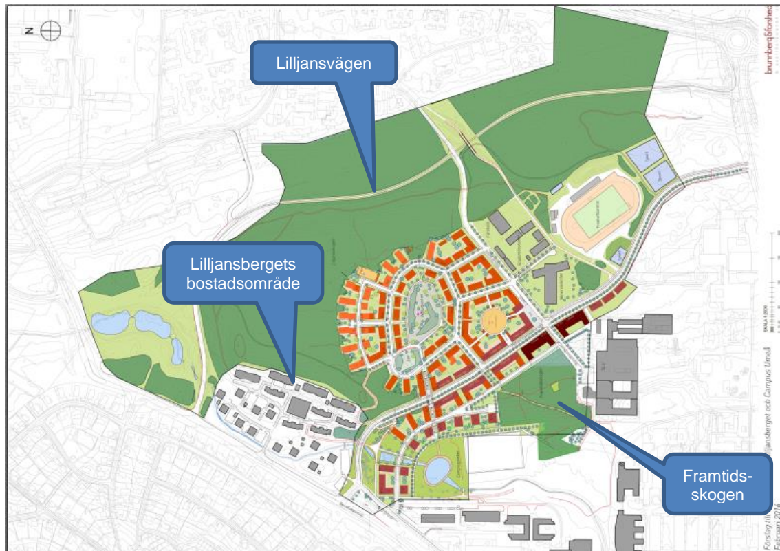
Figur 2 Plankarta från Planprogram Lilljansberget och del av campusområdet, rev april 2016. De gråfärgade byggnaderna är befintliga, de orangea och röda är planerade.