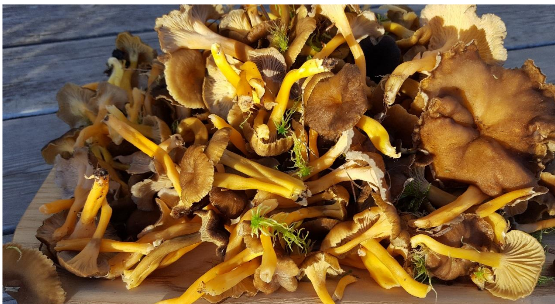
Figur 4 Trattkantareller och gul trumpetsvamp

Den planerade bebyggelsen leder till att utbredningen av områden som kan nyttjas för svamp- och bärplockning minskar betydligt på Lilljansberget. Tillgången på svamp, blåbär och lingon kommer att minska men inte försvinna. Sammantaget försvinner ca hälften av marken som idag kan nyttjas till svamp- och bärplockning.