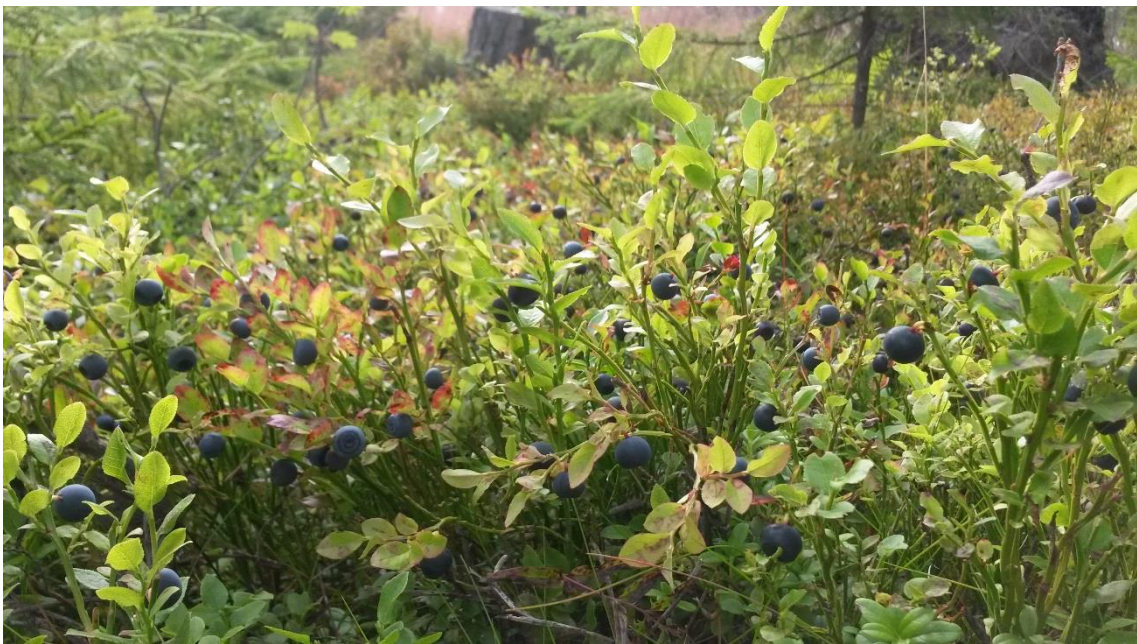
Figur 3. Skogens produktion av bär och svamp är exempel på en ekosystemtjänst.

Ekosystemtjänsterna i området bidrar till nyttor kopplade till rekreativsmöjligheter (naturupplevelser och motion, orientering samt mountainbikecykling), utbildning, dagvattenfördröjning/översvämningsreglering samt produktion av bär och svamp som möjliggör plockning. Förutom dessa nyttor identifierades också funktioner och tjänster som bidrar till livsmiljö för arter och områdets funktion som grön korridor vilket gynnar biologisk mångfald.