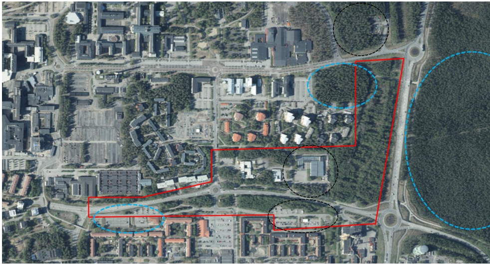
Figur 1. Föreslaget planprogramsområde angivet med röd linje. Pågående detaljplaner markerad med blå streckad linje och positiva planbesked i svart streckad linje.

För att tydliggöra hur området kan exploateras behöver planprogrammet visa hur planområdet i framtiden ska relatera till sin omgivning med Tomtebo strand i öst, Ålidhem i söder och Ålidhöjd/Tvistevägen/Universitetsområdet i norr. Planprogrammet ska utreda strukturer för nya lokalgator, lämplig exploateringsgrad, byggnaders placering, offentliga rum dagvattenhantering och gröna samband. Planprogrammets geografiska avgränsning är schematiskt angiven i Figur 1. Nya förutsättningar som framkommer under arbetet kan innebära att planprogramsområdet utvidgas eller minskas. Hänsyn till pågående detaljplanearbete och positiva planbesked ska tas i planprogramarbetet.