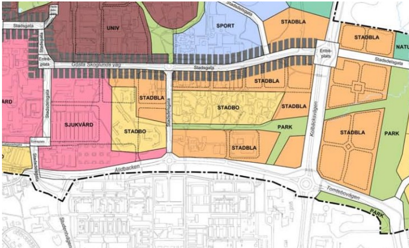
Figur 2. Utsnitt från plankarta fördjupad översiktsplan för Universitetsstaden

Översiktsplan - fördjupning för Umeå förordar kompletteringar inom femkilometersstaden, med målet att uppnå en tät och funktionsblandad stad med hög tillgänglighet som gynnar gång- och cykeltrafik. Översiktsplanen anger att trafikimpediment och andra "överblivna" ytor utgör en stor resurs för att ge plats för ny stadsbebyggelse samt att randzoner/"mellanrum" ska bebyggas så att barriäreffekter övervinns.