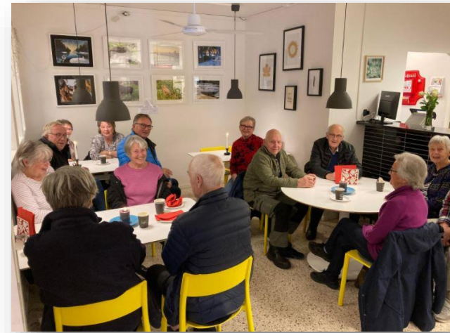
Bild från tisdagsfika hos Handlar'n i Sörmjölle