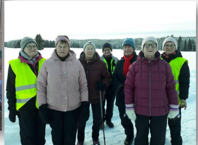
Bild från Tavelsjö. Kl.10 varje måndag och torsdag promenerar damerna ihop och "uppdaterar varandra"