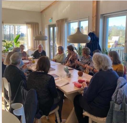
Bild från en hantverkstorsdag i Mötesplats Stöcke