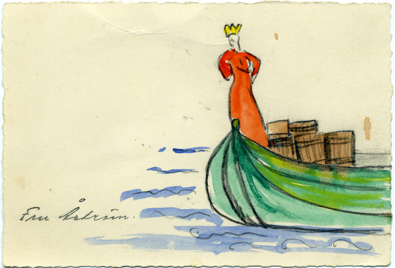
Teckning föreställande kvinna med krona, ståendes i båt med tjärtunnor samt texten "Fru Åström". Tecknare okänd. Folkrörelsearkivet i Västerbotten.