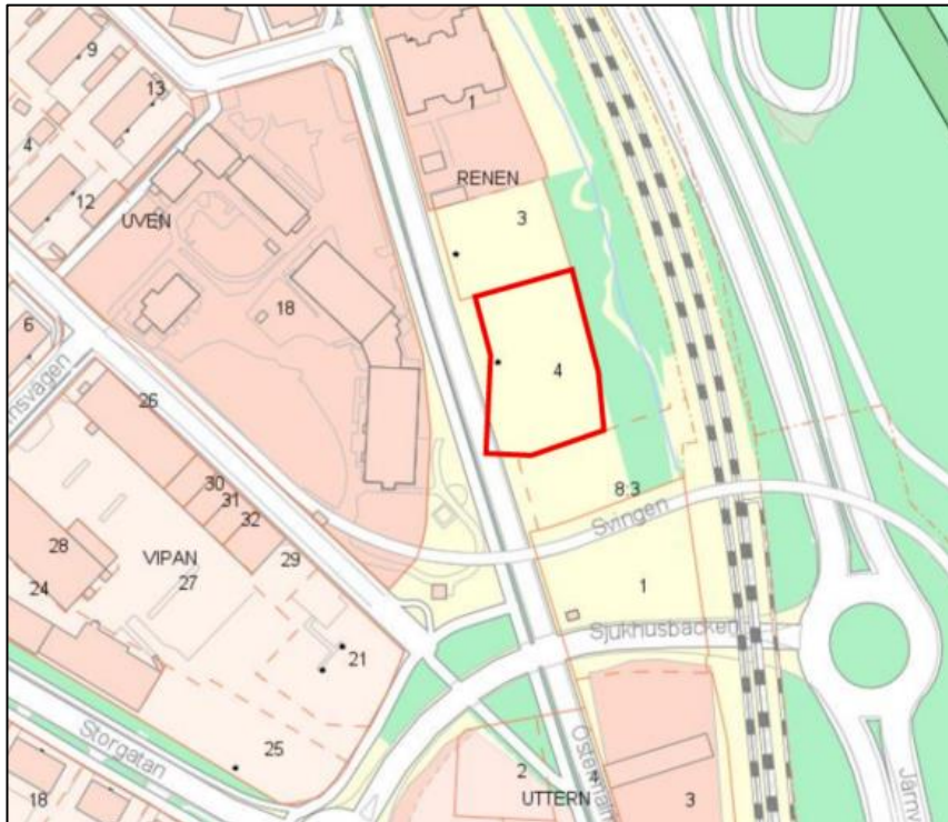
Planområdet som ansökan avser