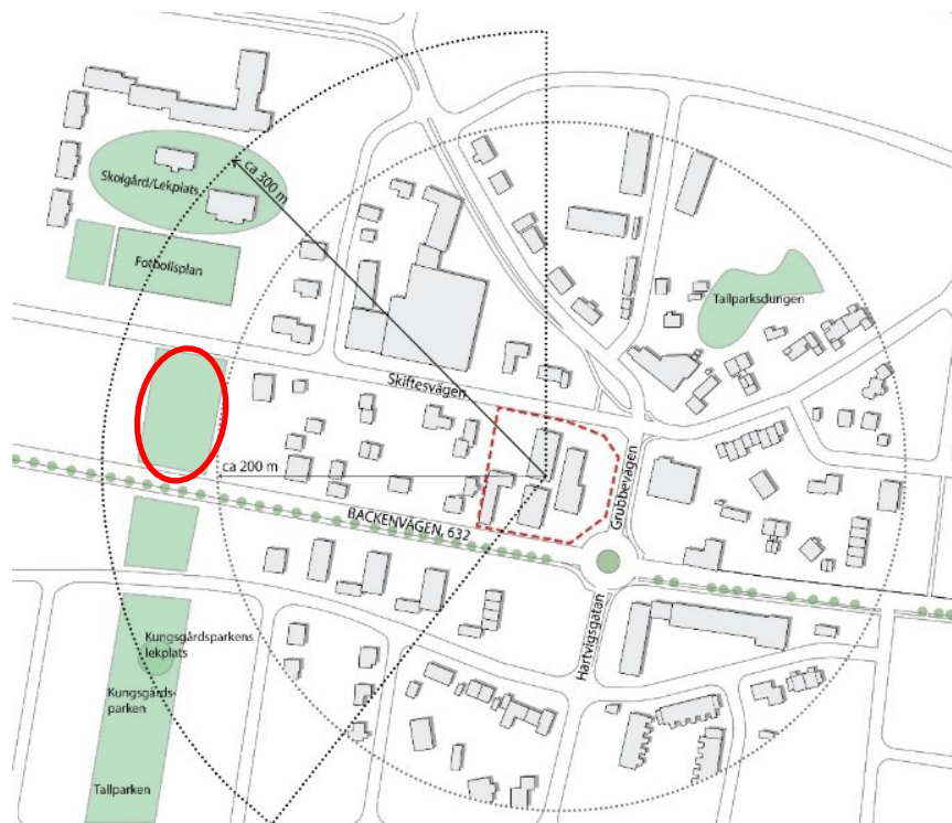
Översiktbild över grönområden i närheten av Syrenen med en grönytta markerat med rött.

Vid ett 100-års regn så finns det risk för översvämning längs Skiftesvägen mellan kvarteret Almen och planområdet. Vakin har därför påbörjat ett arbete med att ställa i ordning en dagvattendamm på en grönytta strax väster om planområdet. Grönyttan är inringat i rött på bilden ovan.