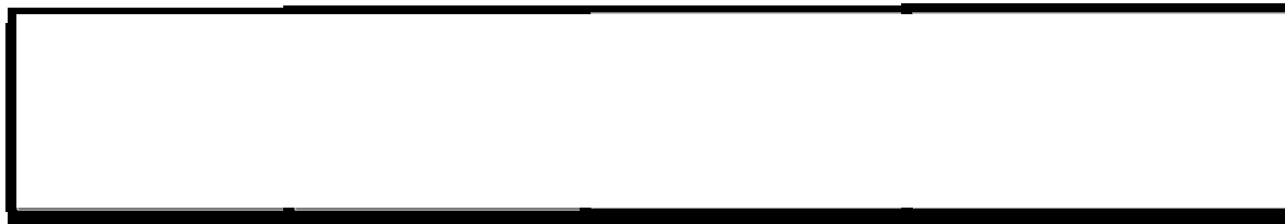
Figur 1 6

Den kommunövergripande risk- och sårbarhetsanalysen baseras på tidigare genomförda analyser, inhämtning av underlag från kommunens olika verksamheter samt underlag och analyser från andra lokala, regionala och nationella aktörer. Hänsyn ska dessutom tas till utvärderingsunderlag från genomförda övningar samt erfarenheter och lärdomar från stora och små kriser. I detta arbete ska respektive verksamheters kritiska beroenden identifieras för att kunna upprätthålla sin verksamhet. Sedan ska riskbilder behandlas utifrån konsekvenser, förmåga och åtgärdsbehov vilket utgör underlag för vidare arbete med krisberedskap, se figur nedan.