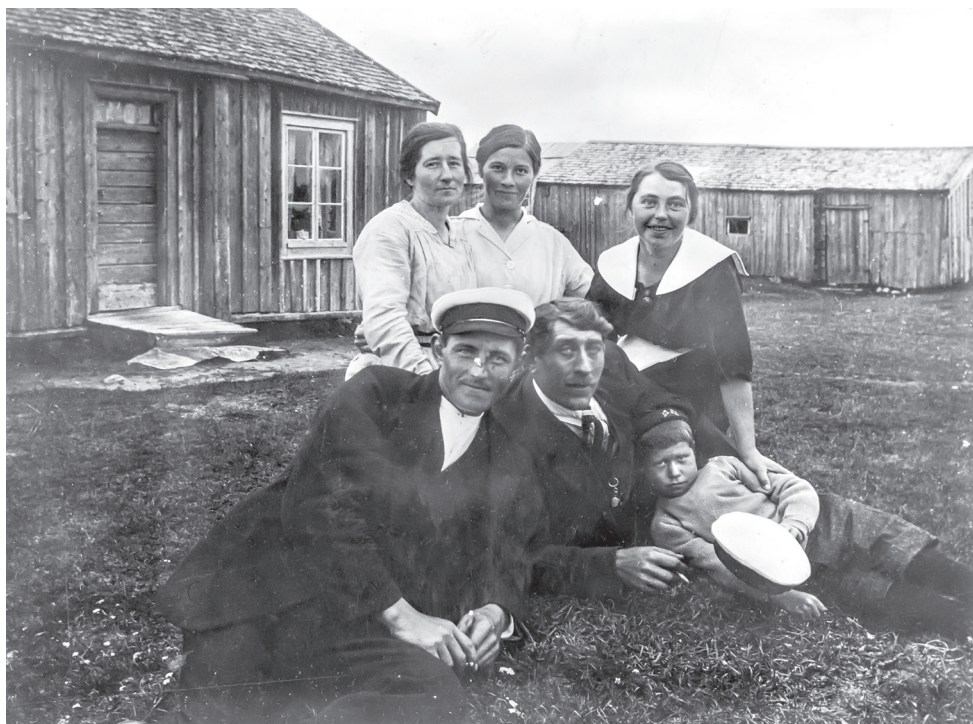
Familjeporträtt vid soldaten Björks soldattorp, rote nr 10 i Stöcke, som var beläget intill den senare uppförda Konsumbutiken. Bilden kommer från insamling av äldre fotografier vid en studiecirkel i Stöcke 1980. Genom förmedling av fru Bertlin har Västerbottens museum mottagit och reproducerat 21 äldre fotografier.

på morgonen. Inledningsvis gick det bra, men längre fram vid en insjö hade solen hunnit bryta nattskorpan och bröderna måste hoppa över sprickorna på sjön. När de kom till Djäkneboda och gästgivargården varnade den gamle gästgivaren dem. Han ropade att de inte skulle gå på isen "såframt Ni icke viljen egenvilligt dränka eder själva". Han ropade att de skulle "gå sommarvägen". De tackade för underrättelsen och lydde hans råd.