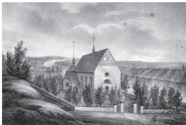
Umeå Landskyrka 1830-tal. Litografi av A. A. Grafström.

I januari 1779, samma år som bränneriet förstördes i en brand, avled en kvinnlig kusin till Pehr Stenbergs far på ett, som Stenberg skriver, "wåldsamt och ynkeligt sätt". Hon var gift med en borgare som hette Forsberg, en "liderlig sälle" som slog och hanterade henne illa. Även sonen hade problem vilket innebar att hela familjen råkade i fattigdom och elände. För att på något sätt klara uppehållet tvingades kvinnan ibland söka arbete på landsbygden. I samband med ett sådant ärende hade hon nu begett sig till en närliggande by, men endast till fots. Hon hade köpt några bockskinn och därefter vänt