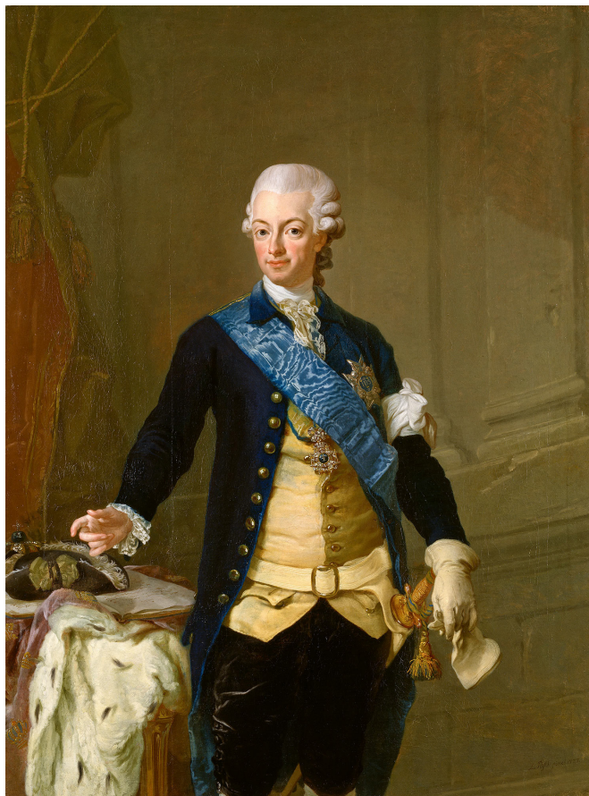
Gustaf III i kuppmarkaruniformen. Kungen knöt en vit armbindel kring sin vänstra överarm för att symbolisera friheten och kuppen. De som slöt upp bakom kungen gjorde detsamma. Oljemålning utförd 1777 av Lorens Pasch d.y. Nationalmuseum, Stockholm.

fortsatte diskussionerna. Men ledamöterna kunde fortfarande inte enas om ett förbud trots hungersnöd i landet efter århundradets sämsta skörd.