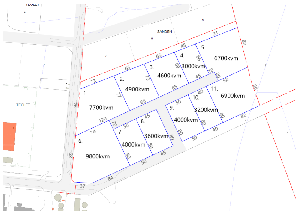
Figur 3. Preliminär fastighetsindelning med areal och mått på fastighetsgränserna. Blå streck visar preliminära fastighetsgränser. Observera att arealerna och måtten på gränserna endast är uppskattade eftersom förrättningen inte är genomförd ännu.

Etapp 2 planeras preliminärt delas upp på 11 fastigheter om ca 3 000–10 000 kvm vardera.