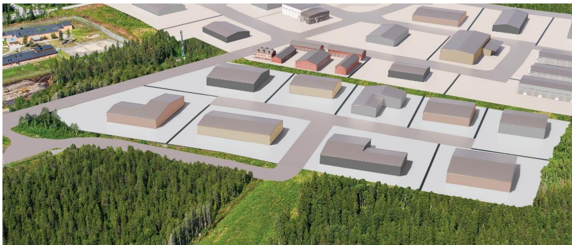
Figur 5. Illustration för byggnation av Östra Ersboda etapp 2. OBS! Illustrationen ska ses som en helhet och inte som en skiss för varje enskild fastighet.

Lämpliga verksamheter för etapp 2 är exempelvis verksamhet för transport och logistik, lager, industrifack, verkstäder, lättindustri, tillverkning; eventuellt inklusive viss försäljning. Det förväntas en ordentlig exploateringsgrad på området och exempelvis upplag bedöms inte lämpligt.