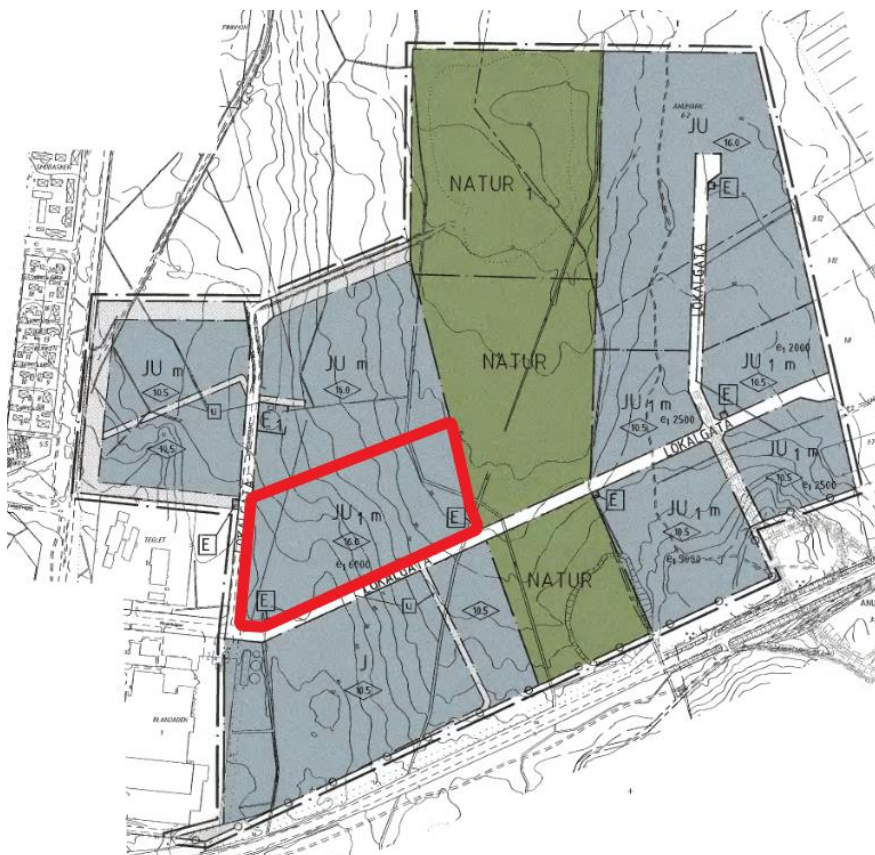
Figur 4. Befintlig detaljplan 2480K-P12/2. Etapp 2 är markerad med röd kantfärg.

Ny detaljplan med mindre justeringar av planområdet är under framtagande. Det främsta syftet med den nya detaljplanen är att planlägga för den kommande etappen, etapp 3.