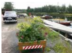
Strana småbåthamn i Täfteå har blivit en träffpunkt