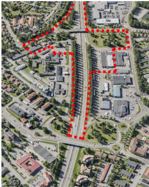
Preliminär avgränsning av planområdet

Stadsutvecklingsprogrammet är uppdelat i fem etapper, och etapp A som denna ansökan avser behöver vara först ut i kommande planering då den möjliggör för Tegsesplanadens omvandling, vilket är en förutsättning för efterföljande etapper.